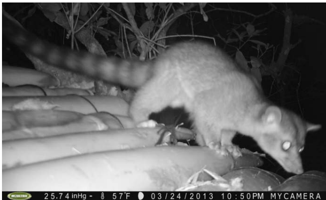
c) Imagen de trampa cámara sobre un tapesco en montaña La Caguasca.