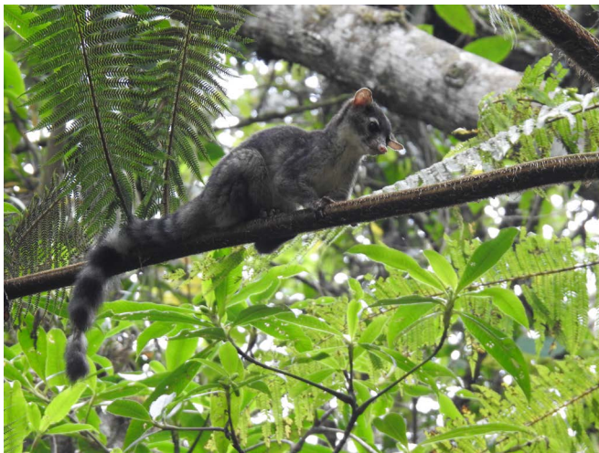
a) Muy rara vez se ven durante el día. Zona núcleo del Parque Nacional Celaque.