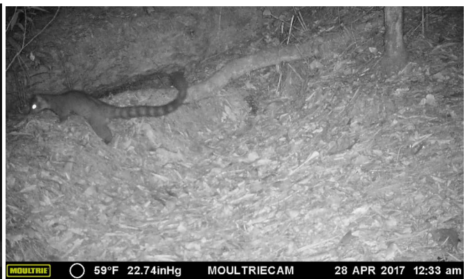
d) A pesar de ser arborícola a veces baja hasta el suelo. Captura de trampa cámara en el Parque Nacional Celaque.