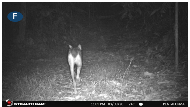
Figura 2. Fotocapturas del coyote en Pavoncito de Sierpe, RFGD (A), en Rancho Quemado de Sierpe, RFGD (B), en Mongos de Sierpe, RFGD (D), en Sábalo de Sierpe, RFGD (E), Santa Cecilia de Piedras Blancas, RFGD (F) y Fotografía directa en el sector Sirena, Parque Nacional Corcovado (C).